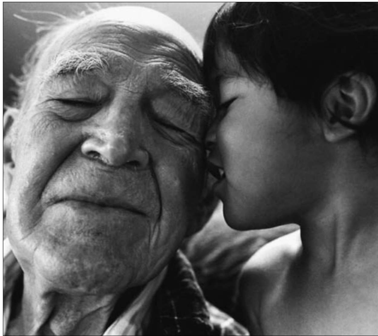
Lindo en Isaac