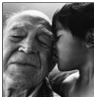
Leven in liefde: de ware passie pagina 14