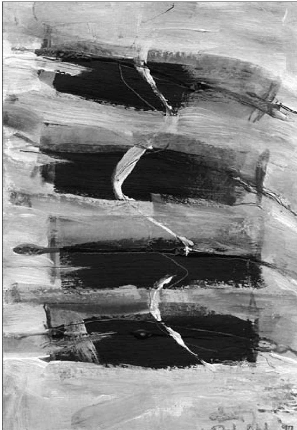
Tekening: Ineke Out